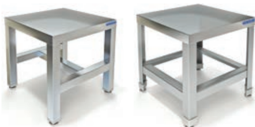
ПОДСТАВКА ПОД ИНВЕНТАРЬ