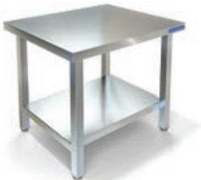
ПОДСТАВКА ПОД ОБОРУДОВАНИЕ