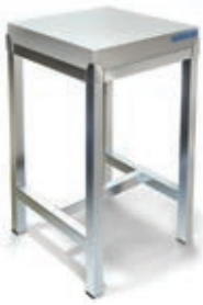
СТОЛ КОЛОДА ДЛЯ РУБКИ МЯСА