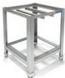
ПОДСТАВКА ПОД КИПЯТИЛЬНИК