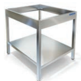
ПОДСТАВКА ПОД ПИЦЦА-ПЕЧЬ КАРКАС РАЗБОРНЫЙ (ТРУБА)