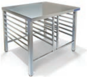
ПОДСТАВКА ПОД ПАРОКОНВЕКТОМАТ ОТКРЫТАЯ