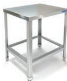
ПОДСТАВКА ПОД УКМ